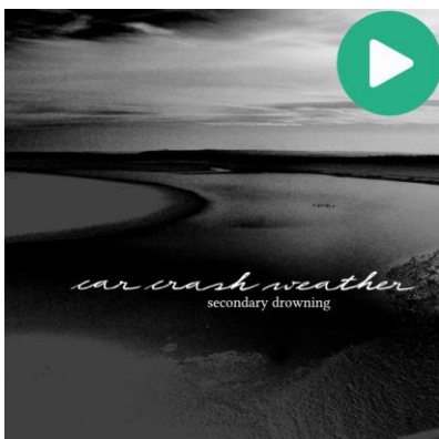
Secondary Drowning (2018), CD & Vinyl