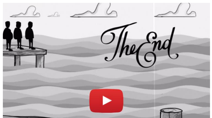
Videoclip - The End